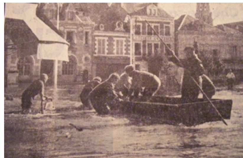
Dans une rue d'Argenton-sur-Creuse, des sauveteurs viennent porter secours à des habitants cernés par les eaux. La Nouvelle République, 5 octobre 1960

ACTIVITÉS COMPÉTENCE HG C.7. Raisonnement, justifier une démarche et les choix effectués. Je sais étudier un document (présenter le document, extraire des informations, les comprendre, les critiquer)