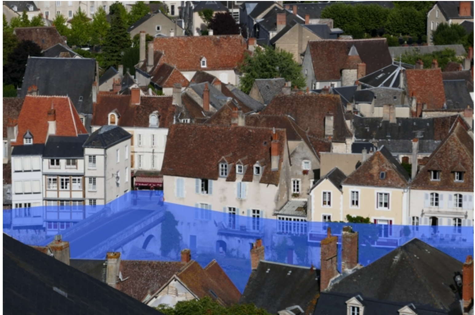
Le quartier du vieux pont. Simulation du niveau atteint par l'eau en 1960.

8. Sur votre cahier, en vous aidant de l'ensemble de vos réponses, rédigez un texte de cinq à dix lignes pour présenter la crue de 1960. (Pensez qu'en le lisant, on doit trouver des réponses aux questions Où ? Quand ? Qui ? Quoi ? Comment ? Pourquoi ?)