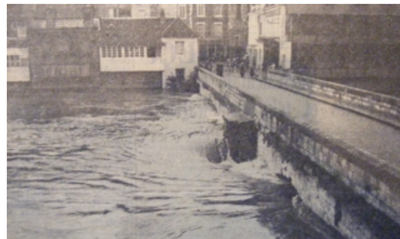
Les flots se ruent avec une violence inouïe sur le Vieux Pont La Nouvelle République, 5 octobre 1960