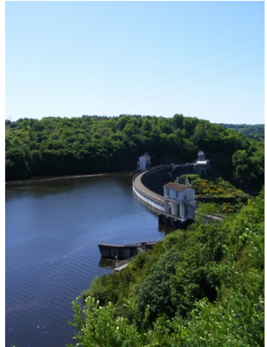
Le barrage d'Éguzon, Photo : L. Pavageau, 2015

4. Doc. 3 : Quelle autre catastrophe certains Argentonnais ont-ils craint ?