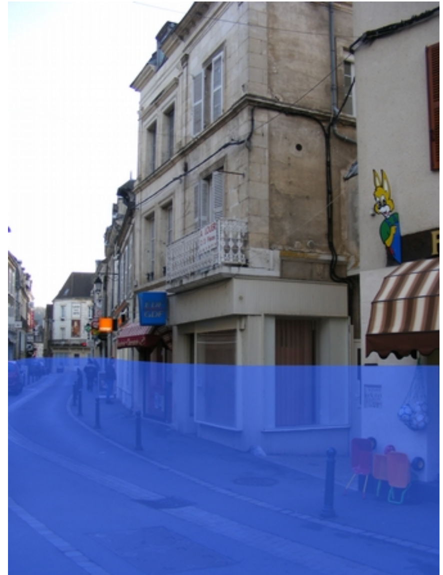
La rue piétonne d'Argenton. Simulation du niveau atteint par l'eau en 1960.